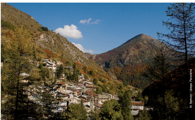
M. Benitozzi - Upega, Panoramia